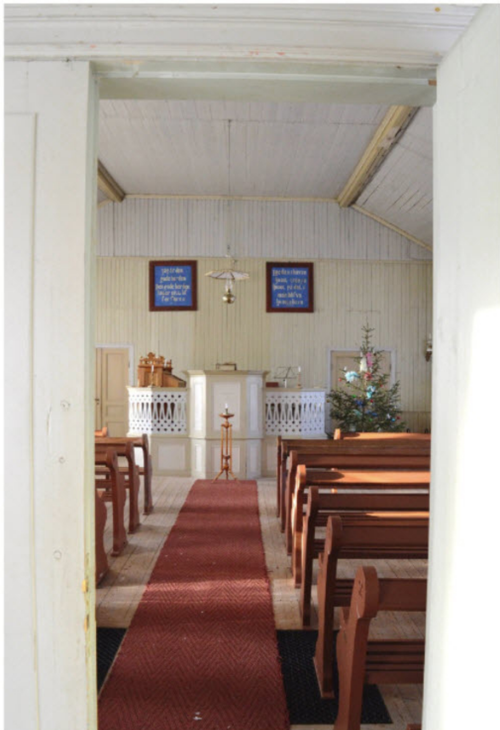
Mycket arbete och ett starkt engagemang för bygden ligger bakom att Kungsbergs bönhus ser ut som nytt, fast från 1900-talets början.