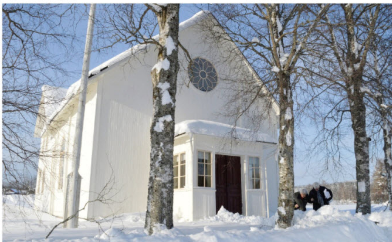
De vita fasaderna och ljusst grågula fönsterfodren målades om år 2013.