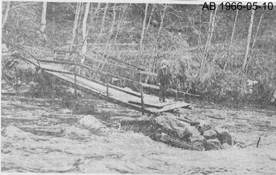
Gångbron över Jädraån nedanför Järbo sågverksförenings kraftstation har blivit hårt åtgången av vårfloden.