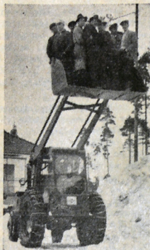
14 stadiga grabbar blir lätta män. »Gigantic» lyfter dem.