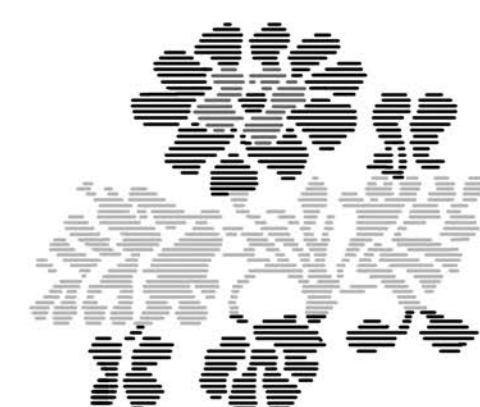
Plockat mönster i tygets väv