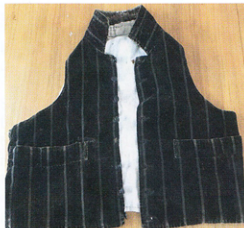
Västen hör till en så kallad bergsmansklädnin bevarad från Ovan sjö socken.

Den bevarade bergsmansklädnin består av en väst i randig sammet och ett par knäbyxor i svart sammet. Sammet verkar vara ganska ovanligt i både mode- och folkdräktsammanhang