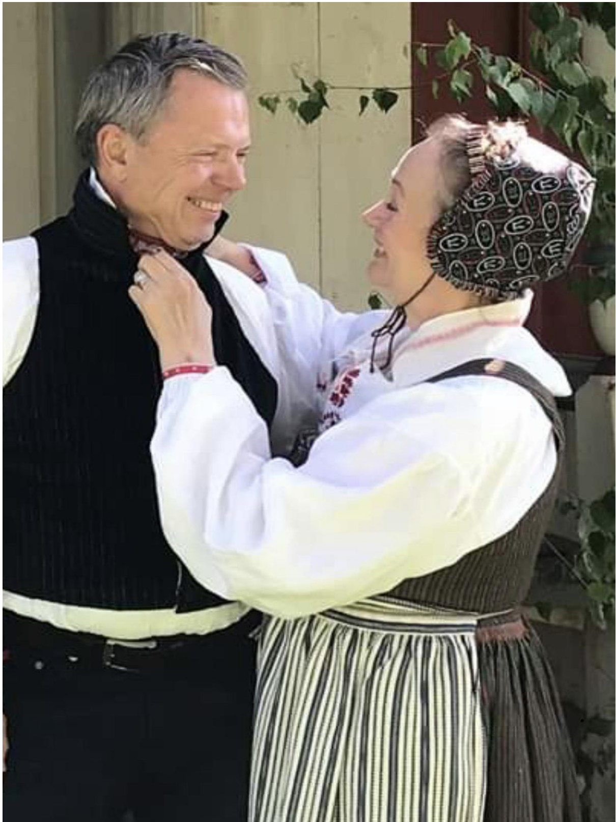
Författaren tillsammans med stolt nutida bergsman, iförd kopia av västen från Ovan sjö. Författaren iförd söndagseftermiddagsdräkt sommarbruk för gift kvinna, Ovan sjö socken, Gästrikland. Alla delar är sydda som kopior efter befintliga originalplagg.