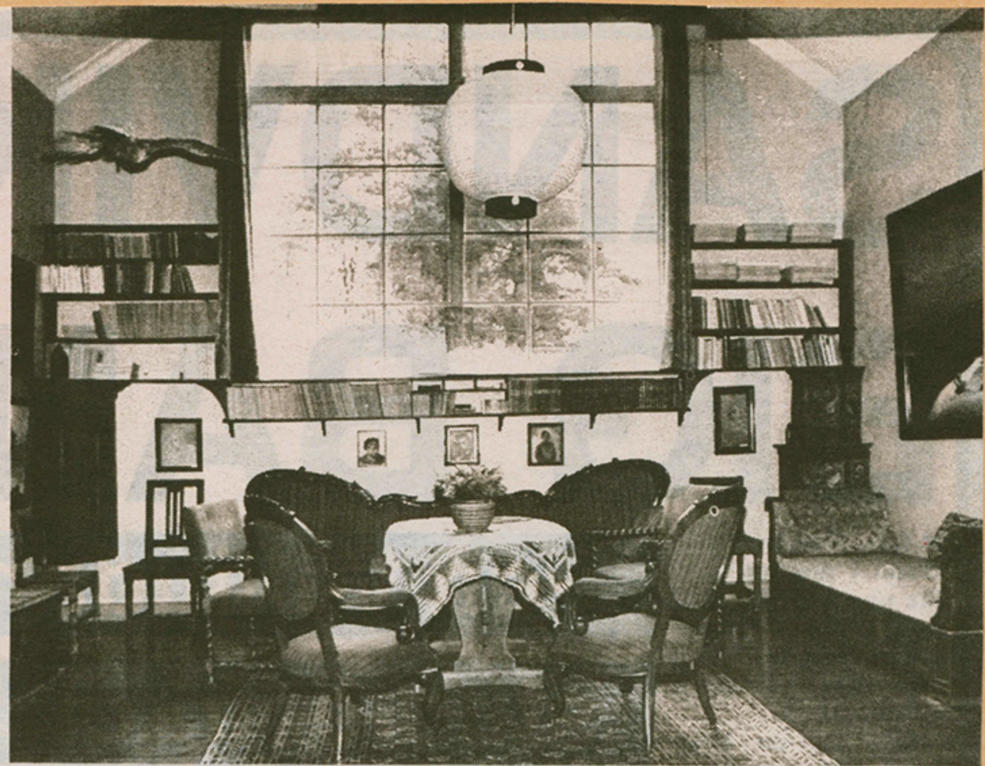
■ I Tallbo kan konstnärer av olika slag arbeta i lugn och ro i en vacker miljö.