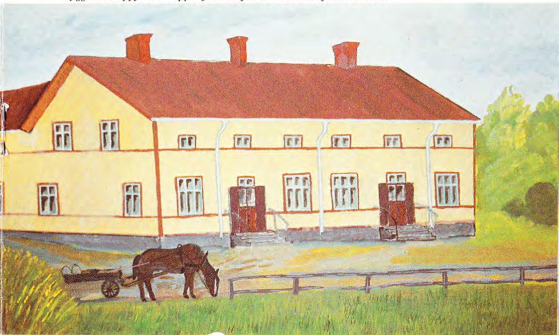
Byggnaden uppförd i etapper från början av 1880-talet fram till 1920