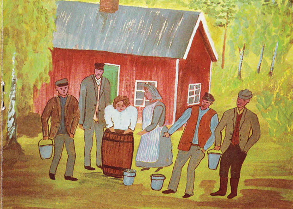
Det började med en tunna sill 1983