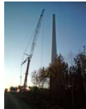
Utsikt från Botjärn mot öster samt bilder från byggsplatsen på Vettåsen, november 2009