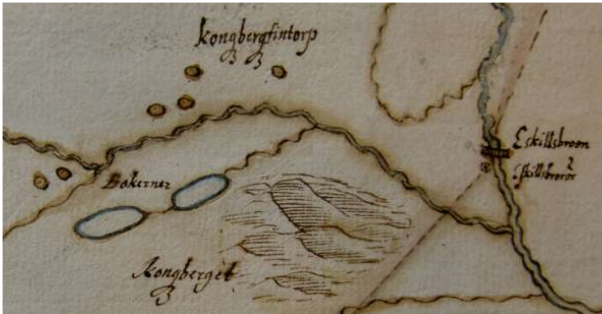
Stenklyfts karta över bl.a Botjärn, Kungsberg och Eskilsbron 1702