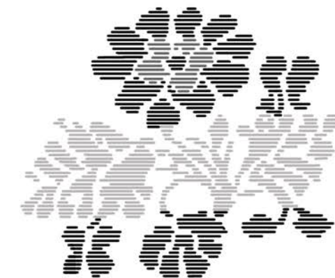
Plockat mönster i tygets väv